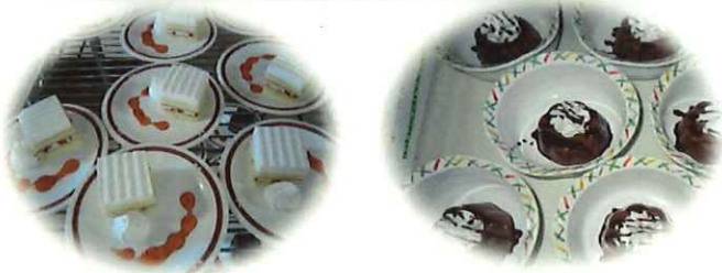
おやつはケーキ、チョコといちごをセレクト