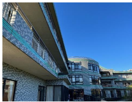
県道側からの全景