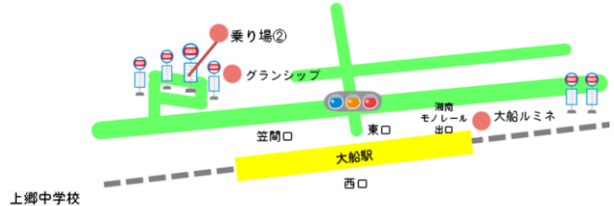
JR 大船駅バス乗り場案内図