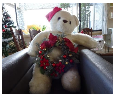
ロビー (クリスマス仕様)