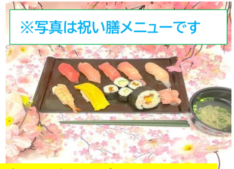
※写真は祝い膳メニューです

※短時間の方は入浴及び昼食・おやつは含まれません。 広々とした浴室があり、車椅子の方も入浴可能な機械浴もあります。